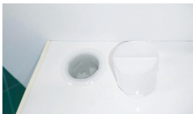
Pジョイント（接続パーツ）