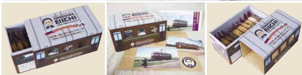
段ボール製のスリーブパッケージ 王子電車を見守る渋沢栄一翁をイメージしたポストカード 職人手作りのロシアケーキが10個6つの味が楽しめる