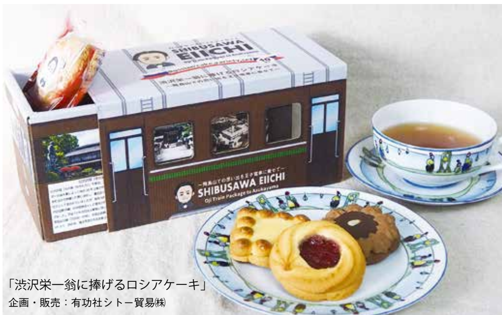
「渋沢栄一翁に捧げるロシアケーキ」 企画・販売：有功社シトー貿易㈱