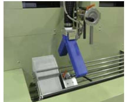
エアノズル部拡大