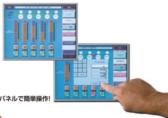
タッチパネルで簡単操作!