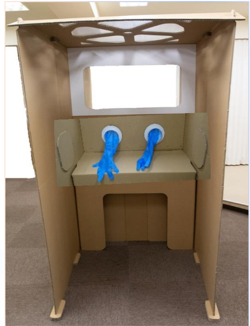
立位タイプ(PCR検査用) 仕切り窓と机が標準タイプよりも 高く設置されています。