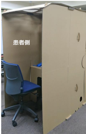
コンパクトタイプ 標準タイプの医師側を省いたタイプです。