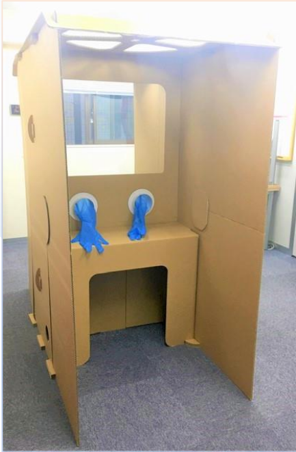
標準タイプ 患者・医師用の机が 付属するタイプです。