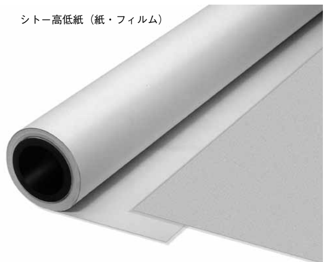
シート高低紙 (紙・フィルム)